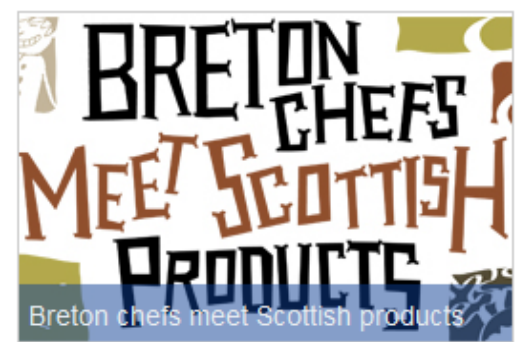
Bretagne - Écosse 2011 | Saturday 14 May 12:00-18:00