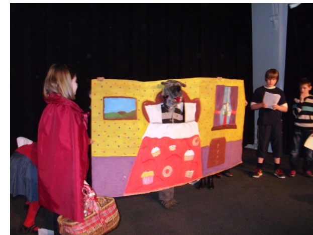
Midcalder primary school