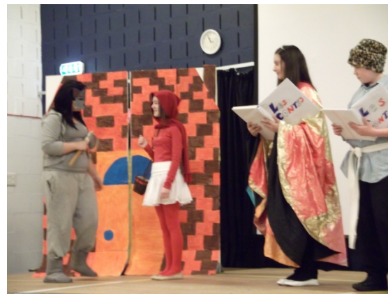
Buksburn Academy, Aberdeen