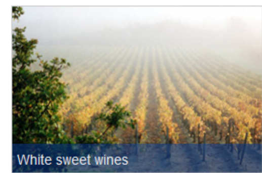
White sweet wines