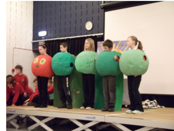
Bramble brae school, Livingston